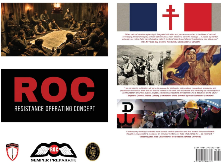
Zdjęcie 7. Okładka Resistance Operating Concept